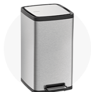
Limpeza e Organização